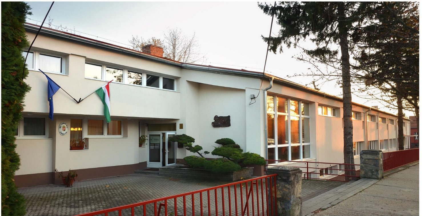
BUDAKESZI NAGY SÁNDOR JÓZSEF GIMNÁZIUM